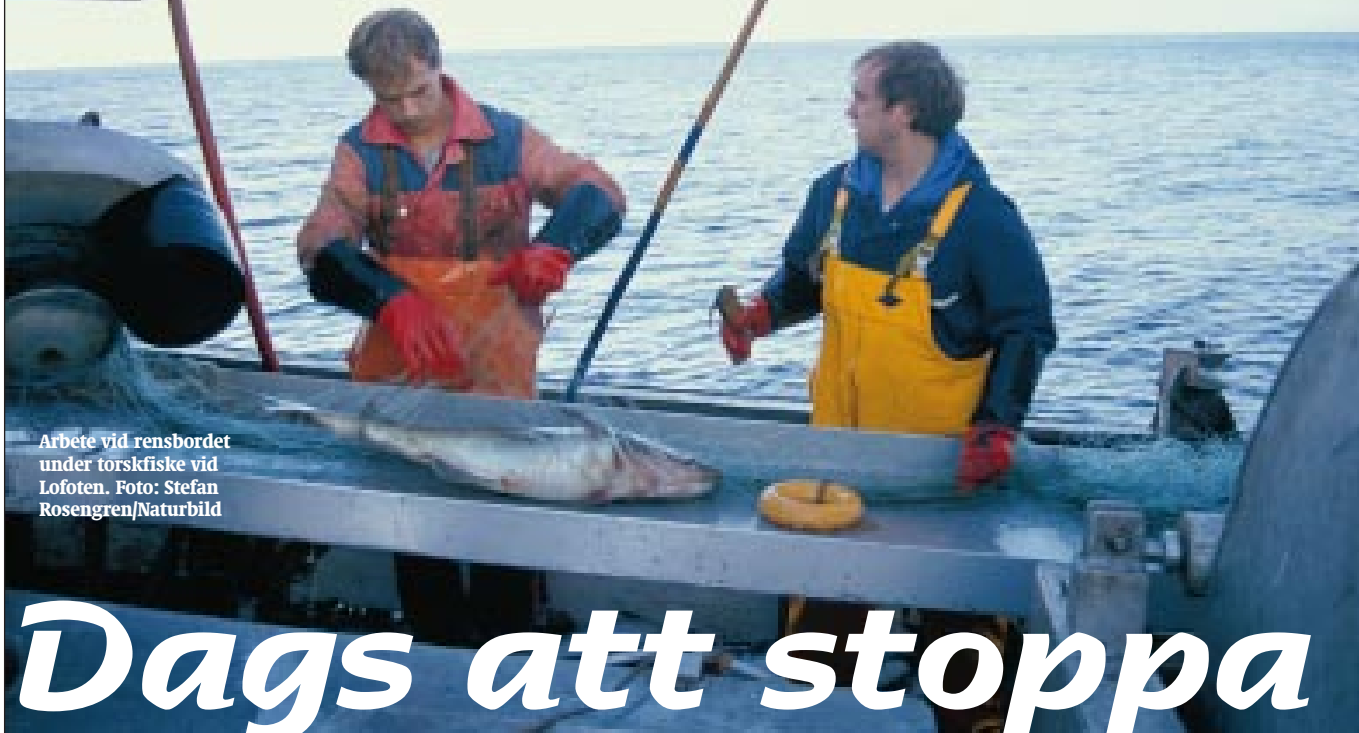
Arbete vid rensbordet under torskfiske vid Lofoten.