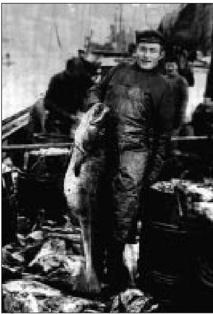
→ Så här stora torskar fångas inte idag. Denna torsk fångades i början av 1900-talet i nordöstra Atlanten.